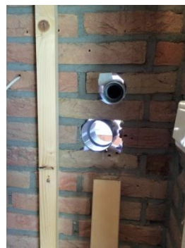
nieuw gat geboord