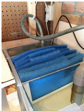
Filter in werking