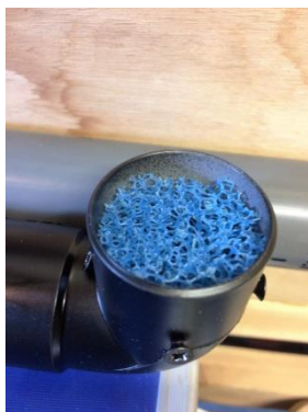
Gaas in toevoer