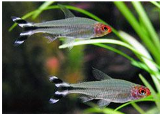
Hemigrammus bleheri / Petitella georgiae

En last but not least een aantal Sturisoma aureum