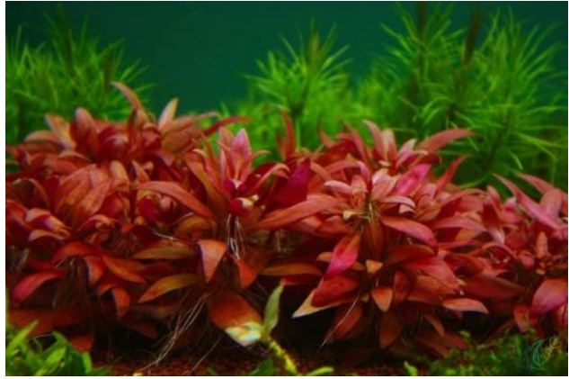
Alternanthera reineckii Mini